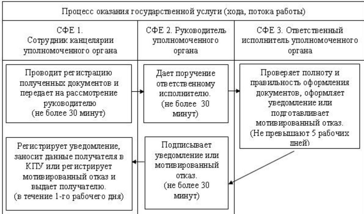
Схема функционального взаимодействия

У т в е р ж д е н п о с т а н о в л е н и е м К а р а г а н д и н с к о й о т 28 м а р т а 2013 г о д а N 18/03