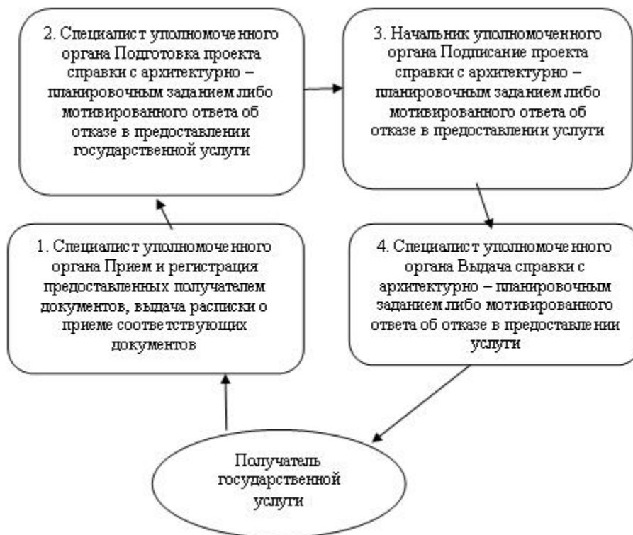
Схема процесса оказания государственной услуги для объектов строительства, указанных в подпункте 2) пункта 7 Стандарта: