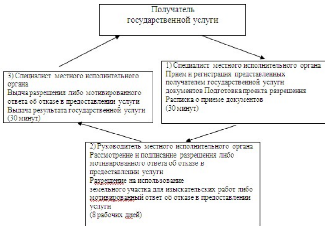
Схема процесса предоставления государственной услуги

к регламенту государственной услуги "Выдача разрешения на использование земельного участка для изыскательских работ"