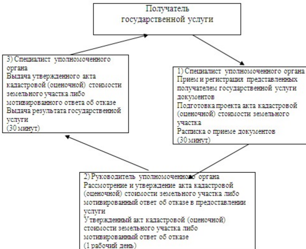
Схема процесса предоставления государственной услуги

стоимости конкретных земельных участков, продаваемых в частную собственность государством"