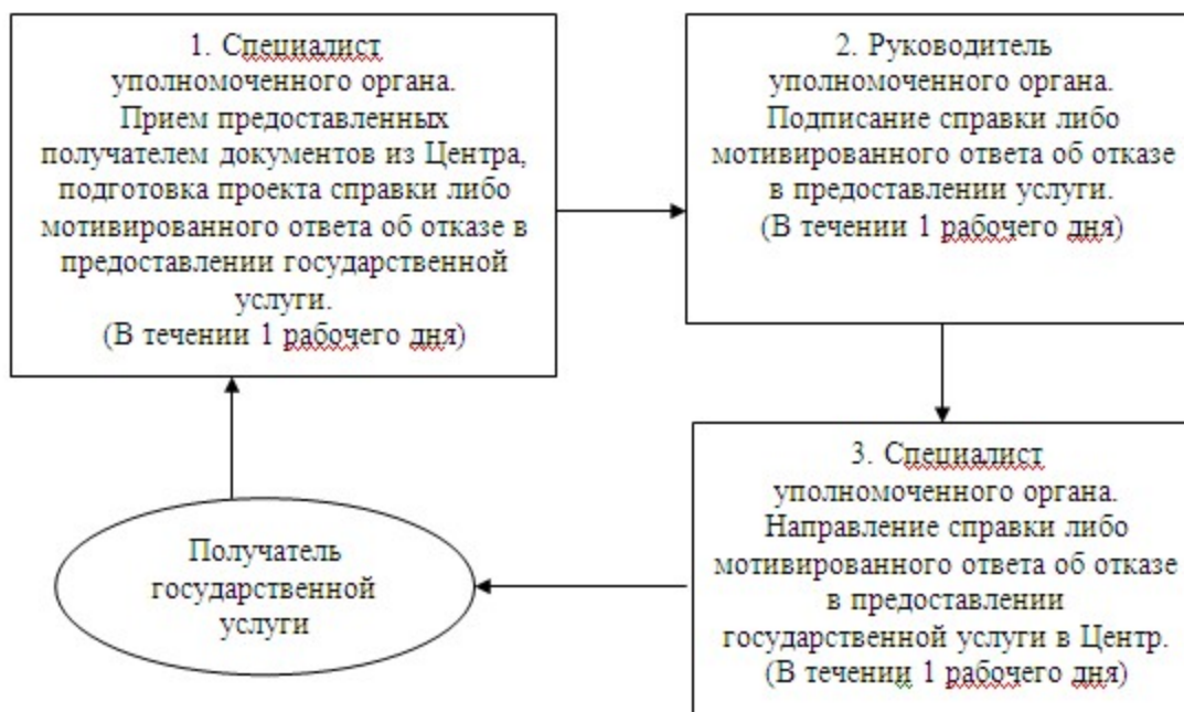
Схема процесса оказания государственной услуги при присвоении, изменении или упразднении адреса объекта недвижимости