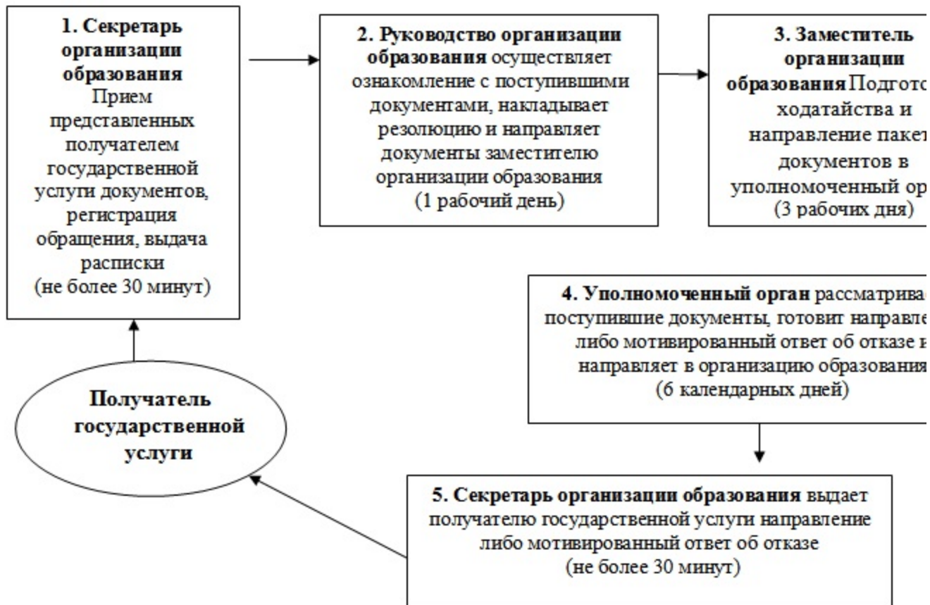
Схема 2. Описание действий СФЕ при обращении получателя государственной услуги в уполномоченный орган