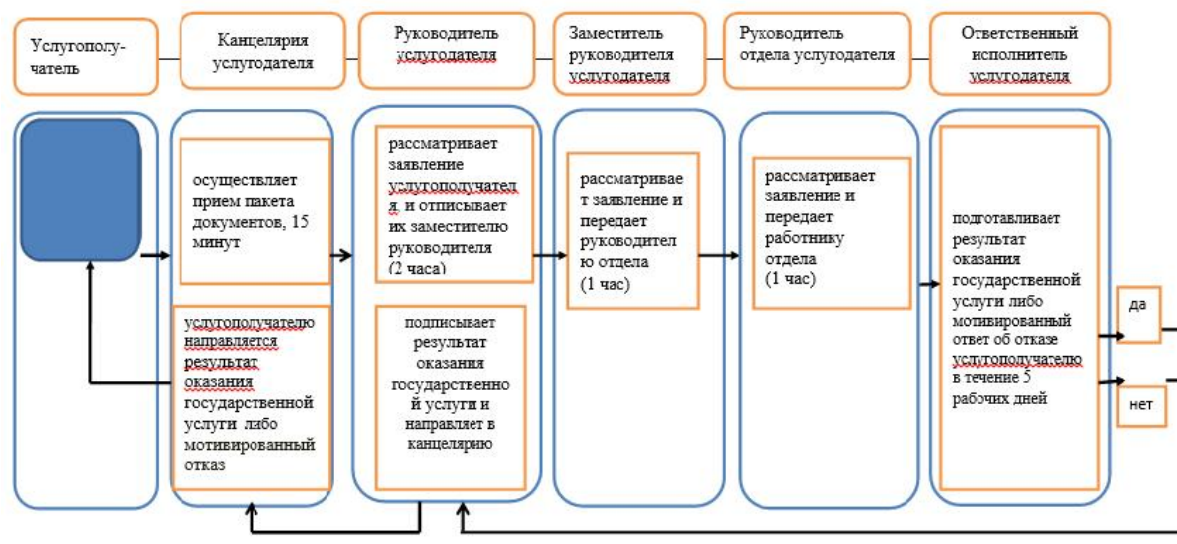
Приложение 3 О внесении изменений и дополнений к регламенту государственной услуги утвержденного постановлением акимата Жамбылской области № 304 от 30.10. 2014 года