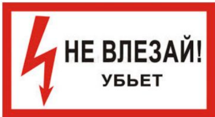
Приложение 12 к Правилам техники безопасности при эксплуатации электроустановок