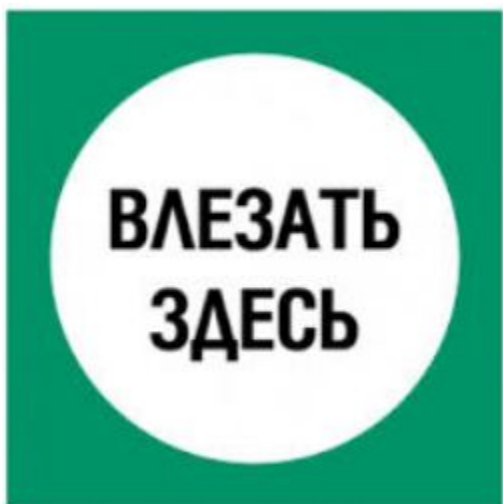
Приложение 13 к Правилам техники безопасности при эксплуатации электроустановок

Вывешивается на стационарных лестницах и конструкциях, по которым для проведения работ разрешено подниматься