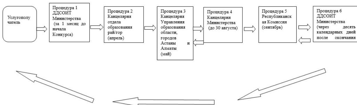
Приложение 2 к регламенту государственной услуги "Прием документов для участия в конкурсе на присуждение звания "Лучший педагог"