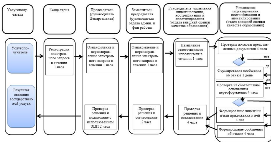
Приложение 4 к регламенту государственной услуги "Выдача лицензии на занятие образовательной деятельностью"

Сноска. Приложение 3 в редакции приказа Министра образования и науки РК от 30.03.2016 № 231 (вводится в действие по истечении двадцати одного календарного дня после дня его первого официального опубликования).