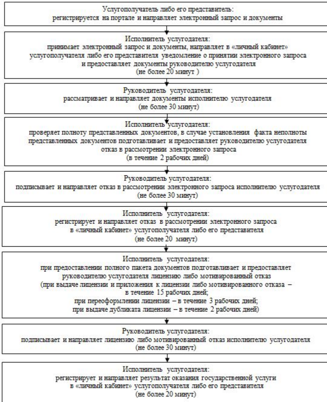
Диаграмма функционального взаимодействия информационных систем, задействованных в оказании государственной услуги в графической форме

Приложение 4 к регламенту государственной услуги "Выдача лицензии на осуществление деятельности на производство (формуляции) пестицидов (ядохимикатов), реализацию пестицидов (