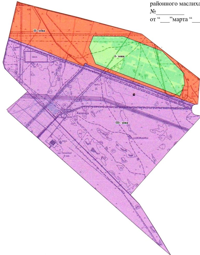
Салық салу мақсатында аймақтардың шартты белгілері Условные обозначения для целей налогообложения

Приложения № 1 к решению Мунайлинского районного маслихата № _____ от “___” марта “_____” года