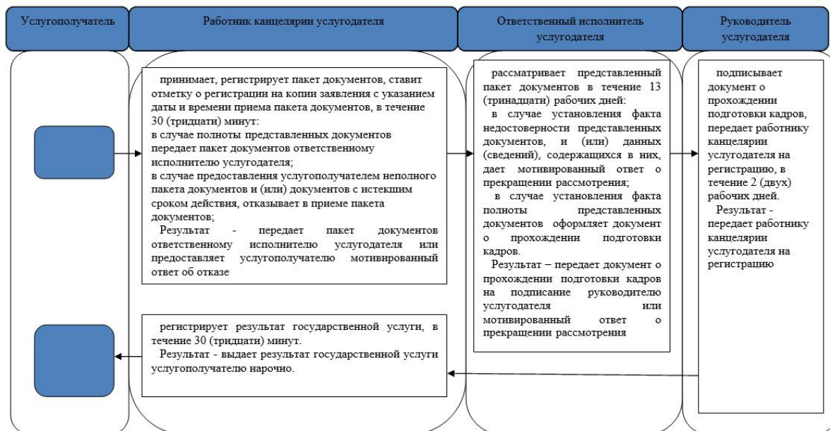
Приложение 2 к регламенту государственной услуги "Выдача документов о прохождении подготовки, повышении квалификации и переподготовке кадров отрасли здравоохранения"