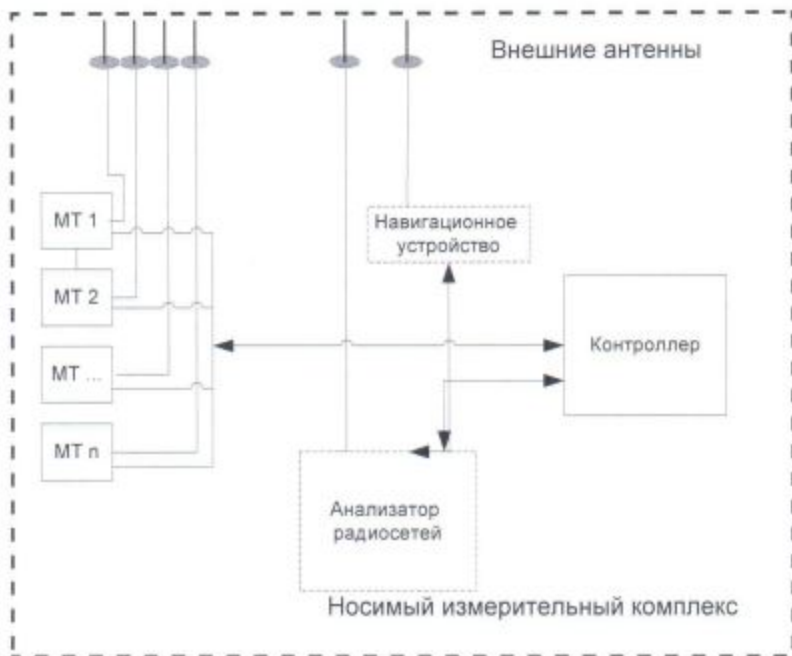
Приложение 4 к Методике измерений технических параметров качества услуг сотовой связи