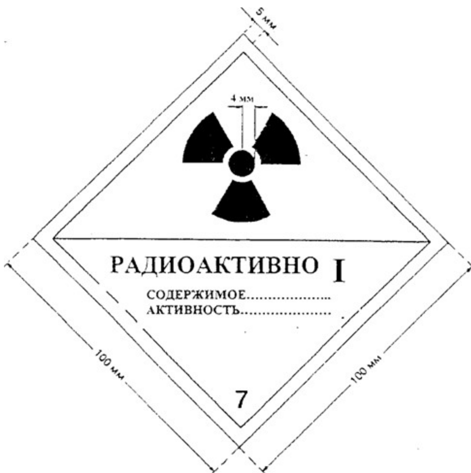
Рисунок 2. Этикетка категории "I-БЕЛАЯ". Цвет фона этикетки - белый, цвет основного знака радиационной опасности (трилистника) и надписей - черный, цвет полосы, обозначающей категорию, - красный.