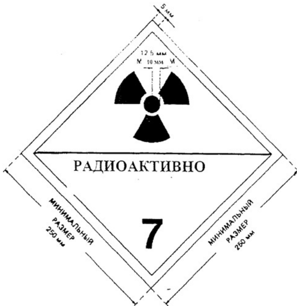
Рисунок 5. Предупредительный знак. Указаны минимальные размеры, при использовании больших размеров следует сохранять указанные пропорции. Высота цифры "7" не менее 25 мм. Цвет фона верхней половины знака - желтый, нижней половины - белый, цвет основного знака радиационной опасности (трилистника) и надписи - черный. Использование слова "РАДИОАКТИВНО" в нижней части необязательно, что позволяет применять этот знак для изображения соответствующего номера ООН для груза.