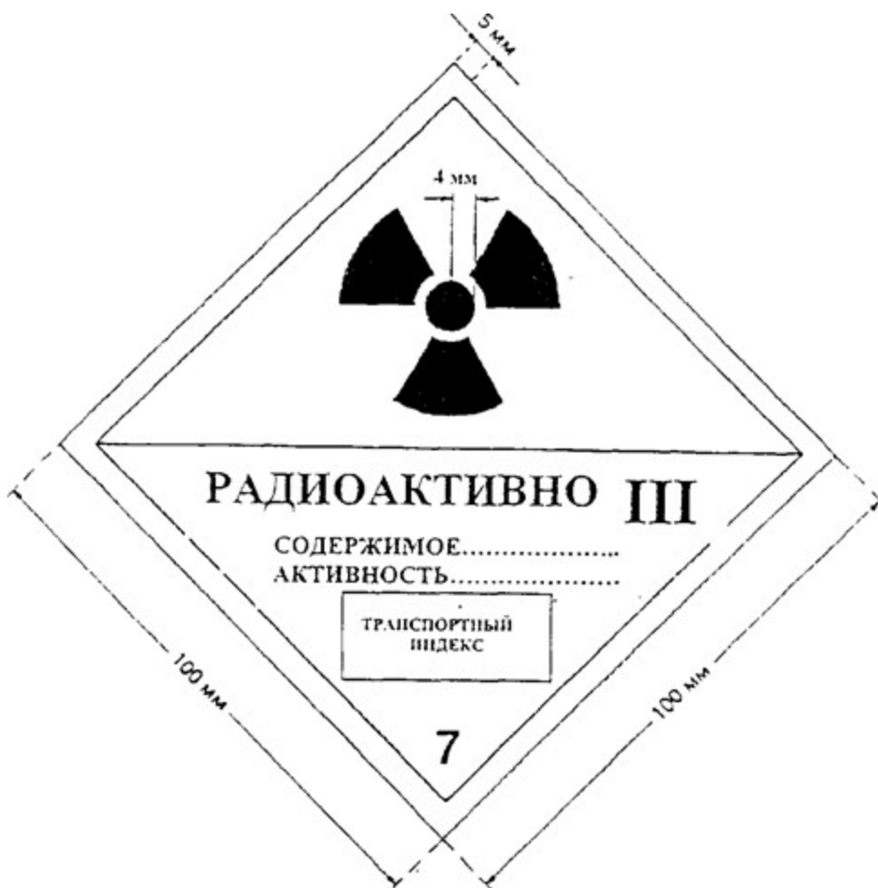
Рисунок 4. Этикетка категории "III-ЖЕЛТАЯ". Цвет фона верхней половины этикетки - желтый, нижней половины - белый, цвет основного знака радиационной опасности (трилистника) и надписей - черный, цвет полос, обозначающих категорию, - красный.