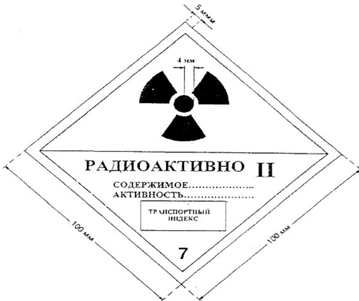
Рисунок 3. Этикетка категории "II-ЖЕЛТАЯ". Цвет фона верхней половины этикетки - желтый, нижней половины - белый, цвет основного знака радиационной опасности (трилистника) и надписей - черный, цвет полос, обозначающих категорию, - красный.