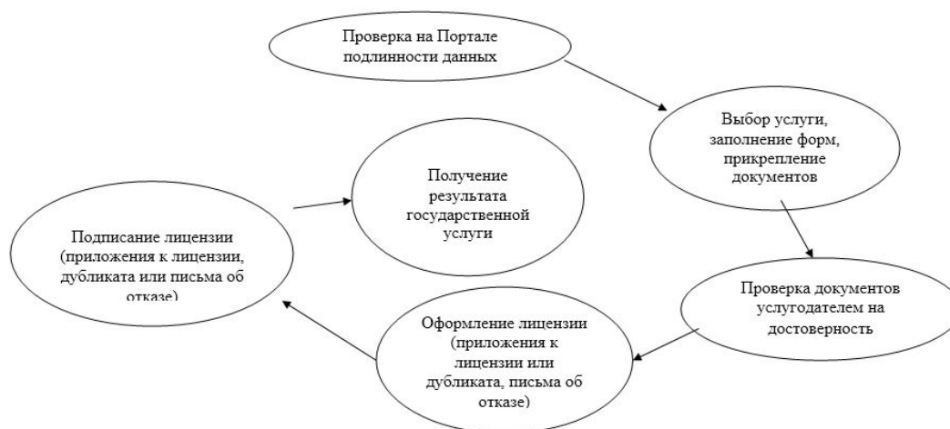
Диаграмма функционального взаимодействия Портала в процессе оказания государственной услуги

Приложение 2 к приказу Министра образования и науки Республики Казахстан от 30 марта 2016 года № 231 Приложение 2 к регламенту государственной услуги "Выдача лицензии на занятие образовательной деятельностью"