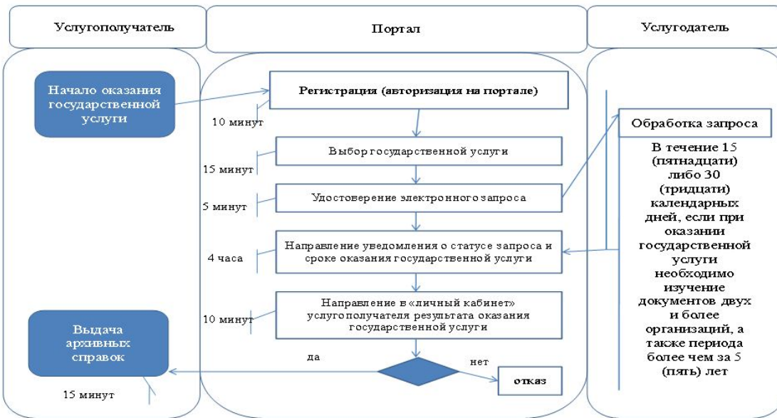
Таблица 3. Справочник бизнес-процессов оказания государственной услуги через портал