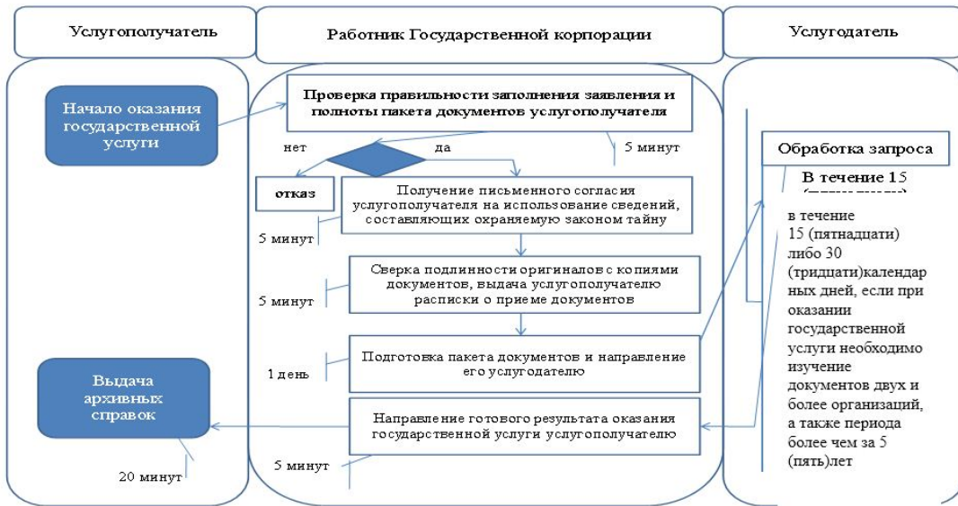
Таблица 2. Справочник бизнес-процессов оказания государственной услуги через Государственную корпорацию