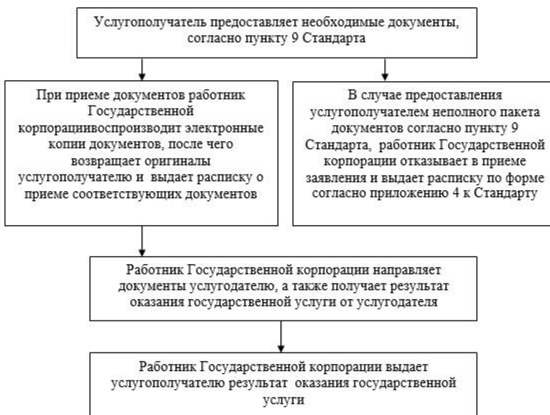
Схема получения государственной услуги при обращении в Государственную корпорацию

Приложение 2 к постановлению акимата Алматинской области от 25 февраля 2016 года № 101