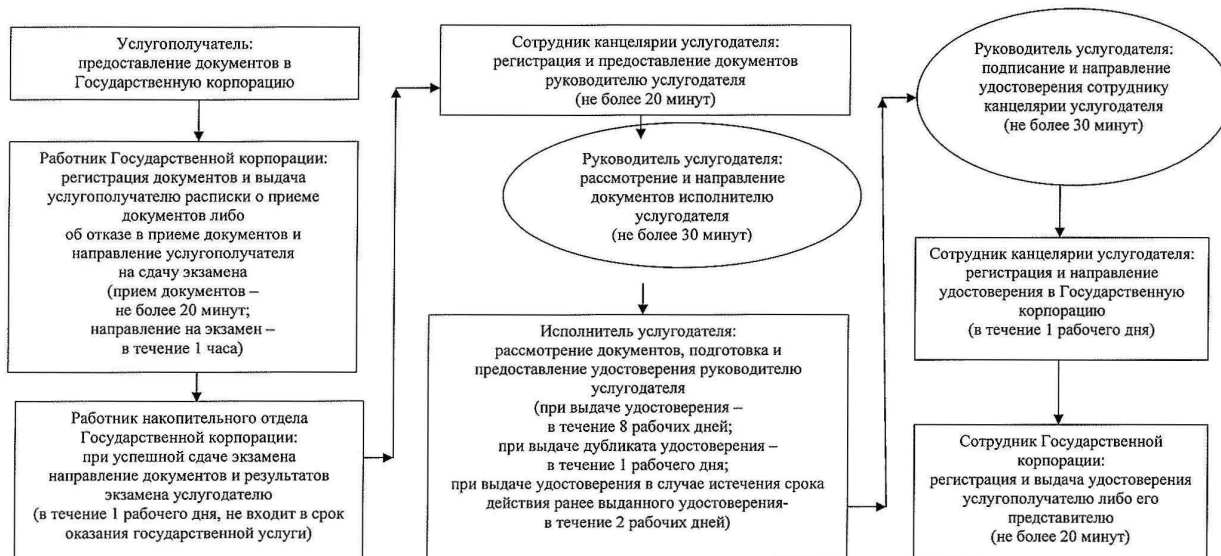
Приложение 3 к регламенту государственной услуги "Выдача удостоверений на право управления самоходными маломерными судами"

Диаграмма функционального взаимодействия информационных систем, задействованных в оказании государственной услуги, в графической форме