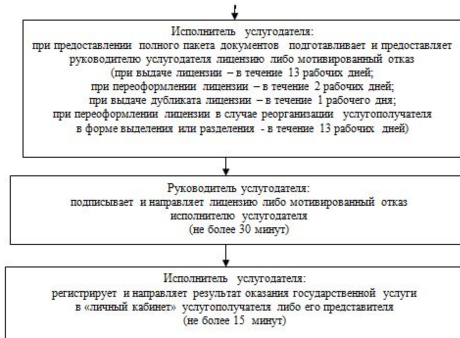
Приложение 4 к регламенту государственной услуги "Выдача лицензии на туристскую операторскую деятельность (туроператорская деятельность)"