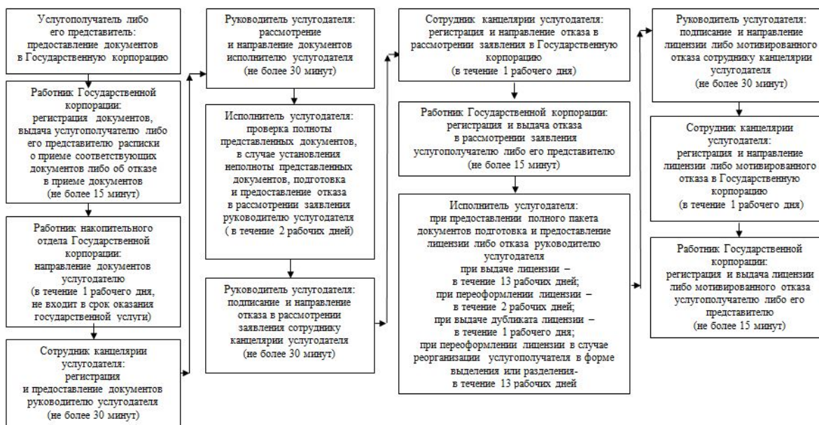
Приложение 3 к регламенту государственной услуги "Выдача лицензии на туристскую операторскую деятельность (туроператорская деятельность)"

Диаграмма функционального взаимодействия информационных систем, задействованных в оказании государственной услуги в графической форме