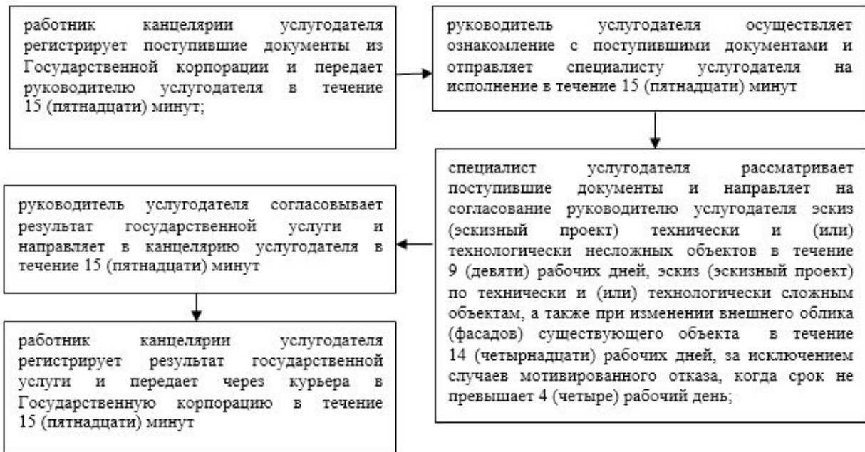
Приложение 2 к регламенту государственной услуги "Согласование эскиза (эскизного проекта)"