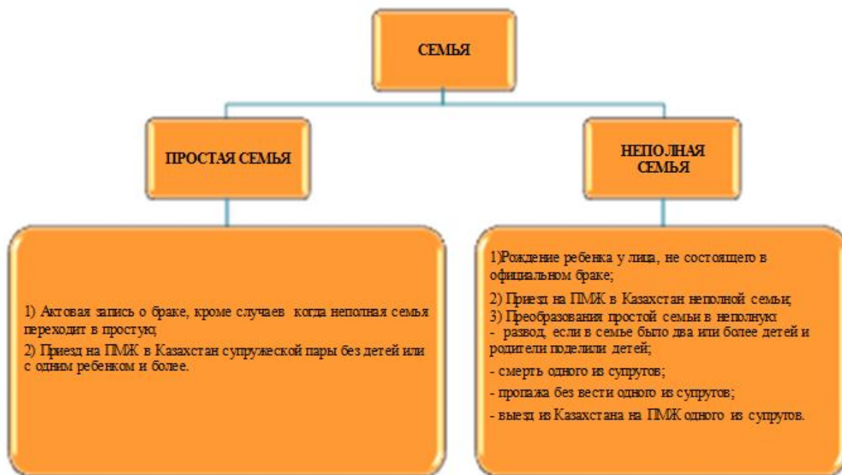
Схема создания статистической единицы "Семья"