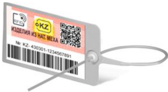
Рис 3. Пример изображения контрольного (идентификационного) знака для навесного (накладного) способа крепления на товар

Примечание: обозначения, используемые на рисунках 1 и 2, означают следующее: