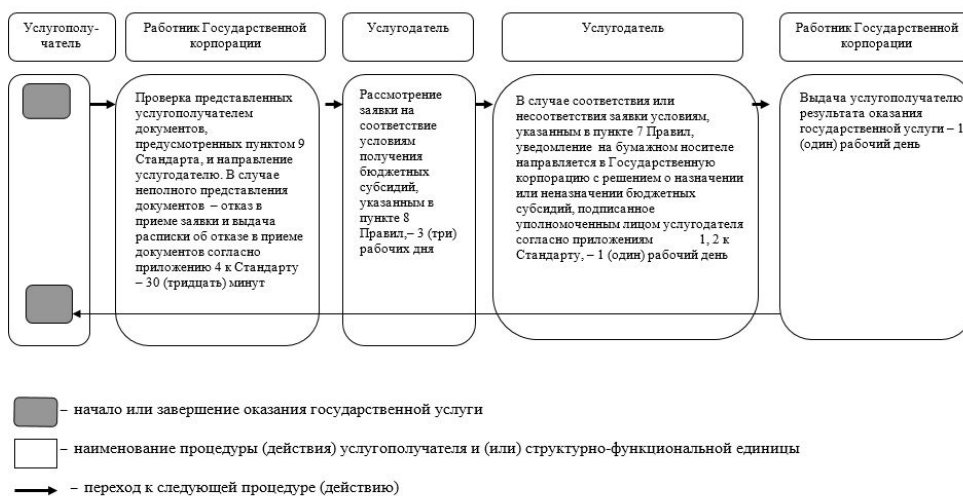
Приложение 3 к Регламенту государственной услуги "Субсидирование стоимости удобрений (за исключением органических)"