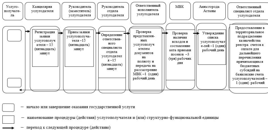
Приложение 2 к Регламенту государственной услуги " Субсидирование стоимости удобрений (за исключением органических)"