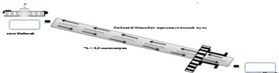
Схема перевозки детей, проживающих на станции Изимбет в Кобелейскую начальную школу, расположенную в селе Кобелей

Приложение 2 к постановлению акимата Мугалжарского района от 25 сентября 2017 г. № 348