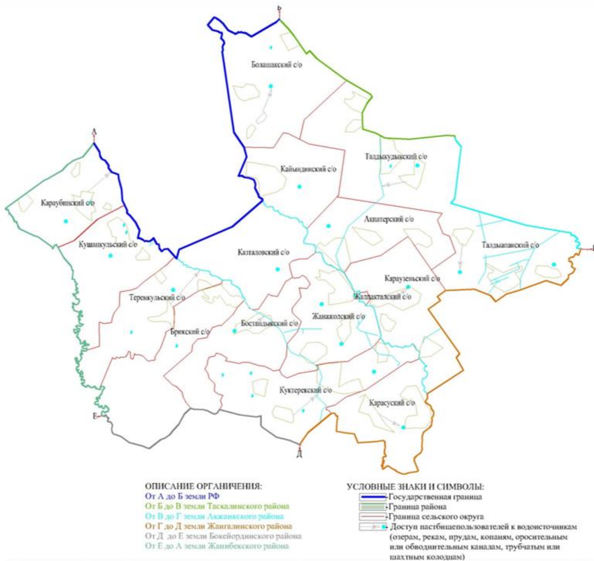
Приложение 5 к Плану по управлению пастбищами и их Использованию по Казталовскому району на 2018-2019 годы

Схема перераспределения пастбищ для размещения поголовья сельскохозяйственных животных физических и (или) юридических лиц, у которых отсутствуют пастбища, и перемещения его на предоставляемые пастбища