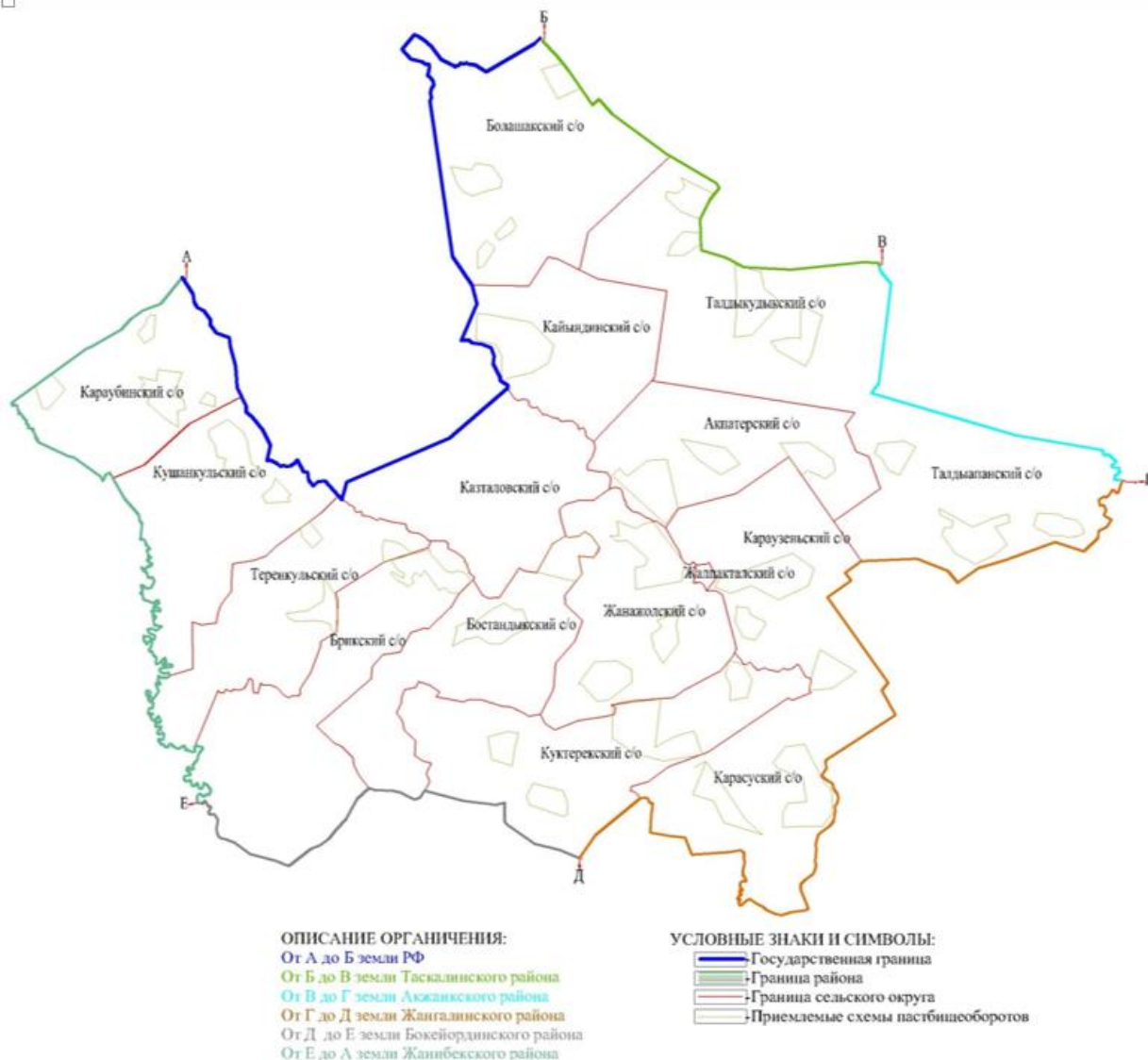
Приложение 3 к Плану по управлению пастбищами и их использованию по Казталовскому району на 2018-2019 годы

Карта с обозначением внешних и внутренних границ и площадей пастбищ, в том числе сезонных, объектов пастбищной инфраструктуры