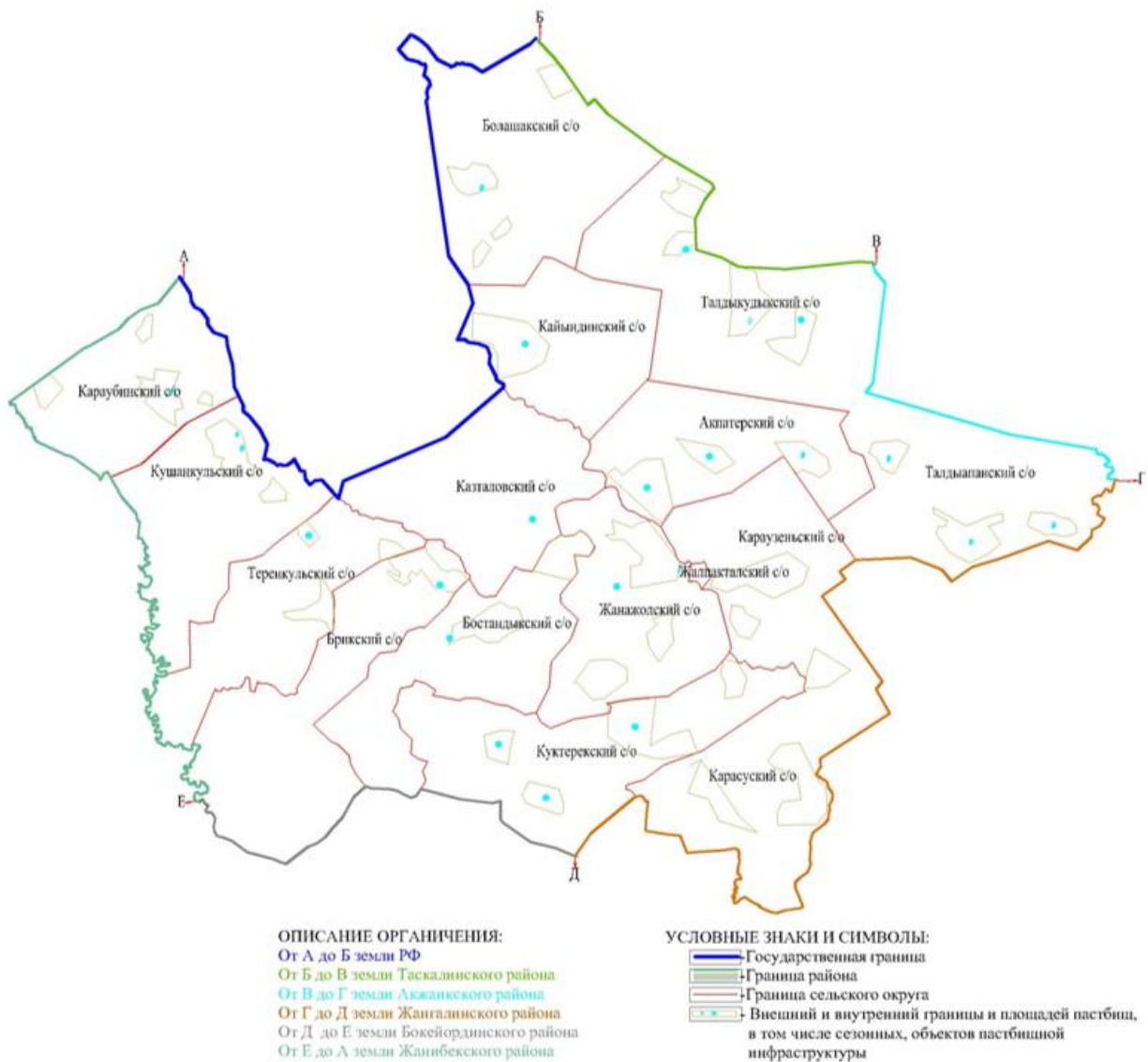
Приложение 4 к Плану по управлению пастбищами и их использованию по Казталовскому району на 2018-2019 годы

Схема доступа пастбищепользователей к водоисточникам (озерам, рекам, прудам, копаням, оросительным или обводнительным каналам, трубчатым или шахтным колодцам), составленную согласно норме потребления воды