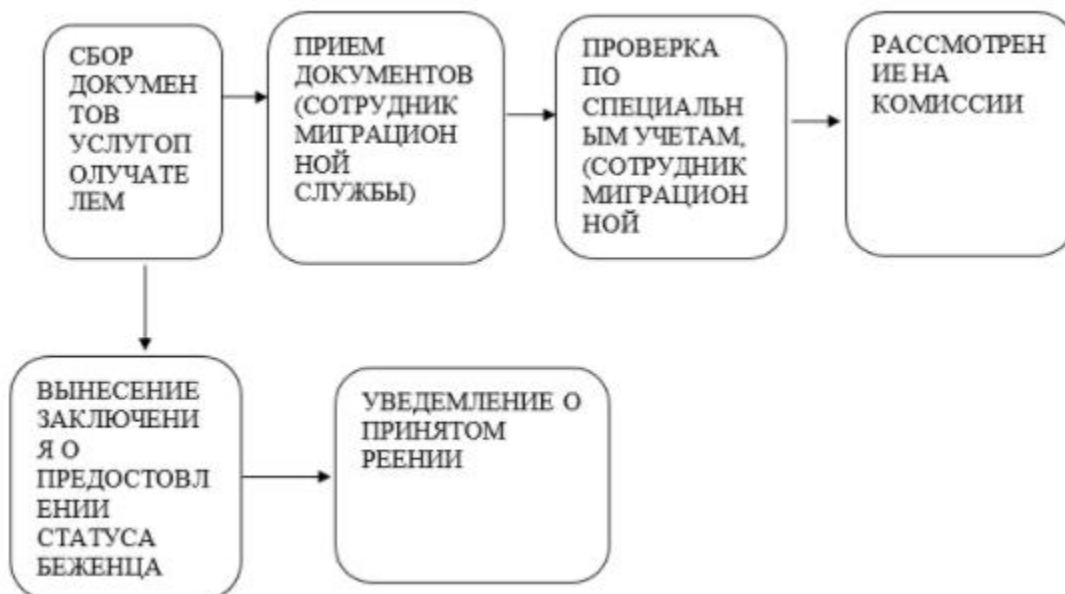
Схема взаимосвязи между логической последовательностью административных действий в процессе оказания государственной услуги и СФЕ

Приложение 7 к приказу Министра внутренних дел