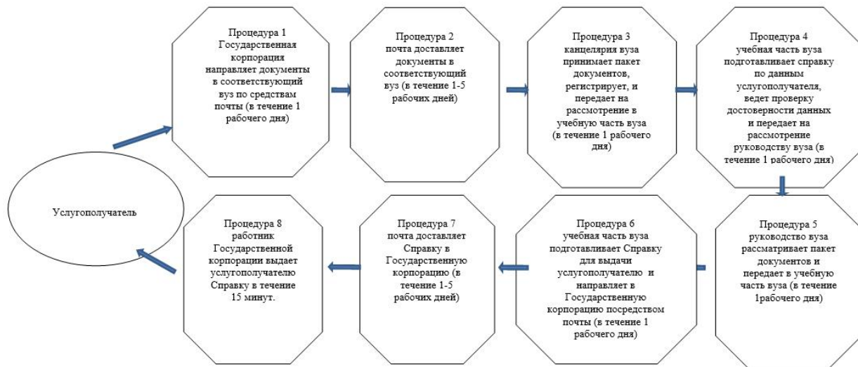
Приложение 3 к Регламенту государственной услуги "Выдача справки лицам, не завершившим высшее и послевузовское образование"