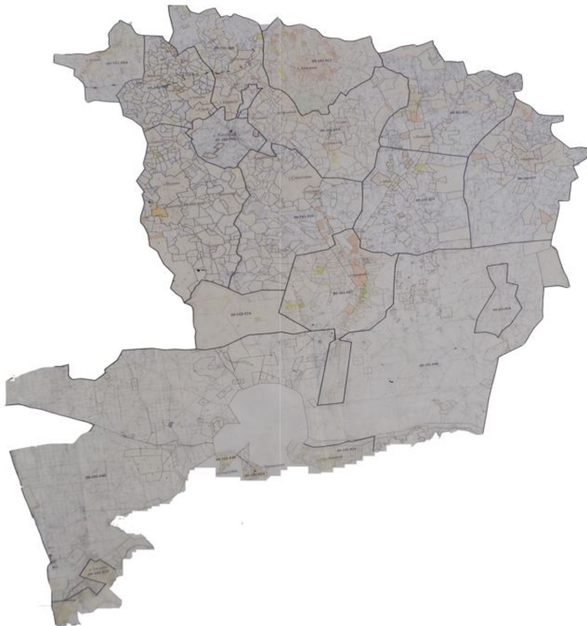
Приложение 7 к Плану по управлению пастбищами и их использованию по Актогайскому району на 2018-2019 годы