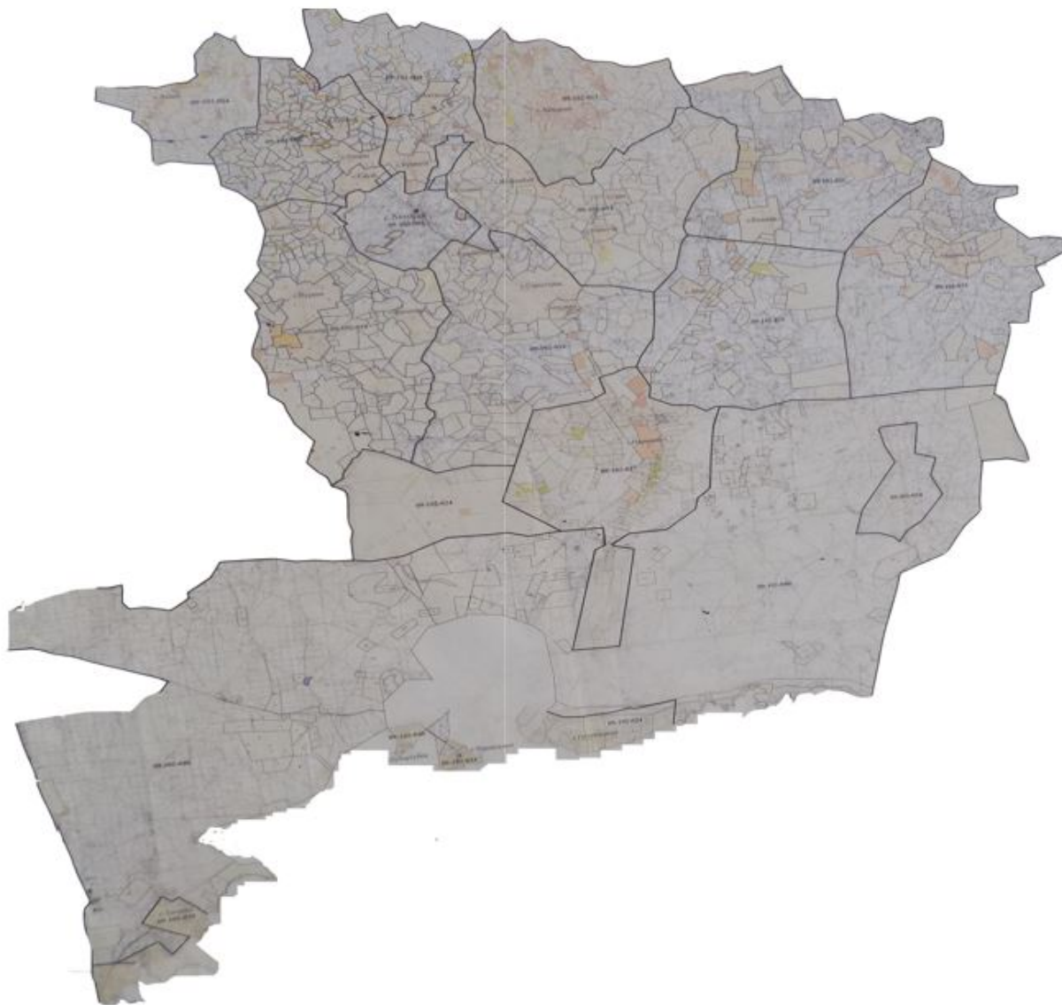
Схема перераспределения пастбищ для размещения поголовья сельскохозяйственных животных физических и (или) юридических лиц, у которых отсутствуют пастбища, и перемещения его на предоставляемые пастбища

Приложение 6 к Плану по управлению пастбищами и их использованию по Актогайскому району на 2018-2019 годы