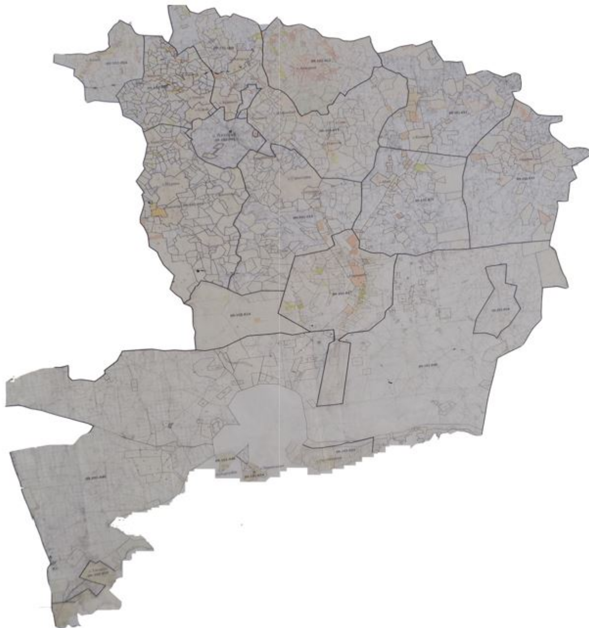
Схема расположения пастбищ на территории административно-территориальной единицы в разрезе категорий земель, собственников земельных участков и землепользователей на основании правоустанавливающих документов