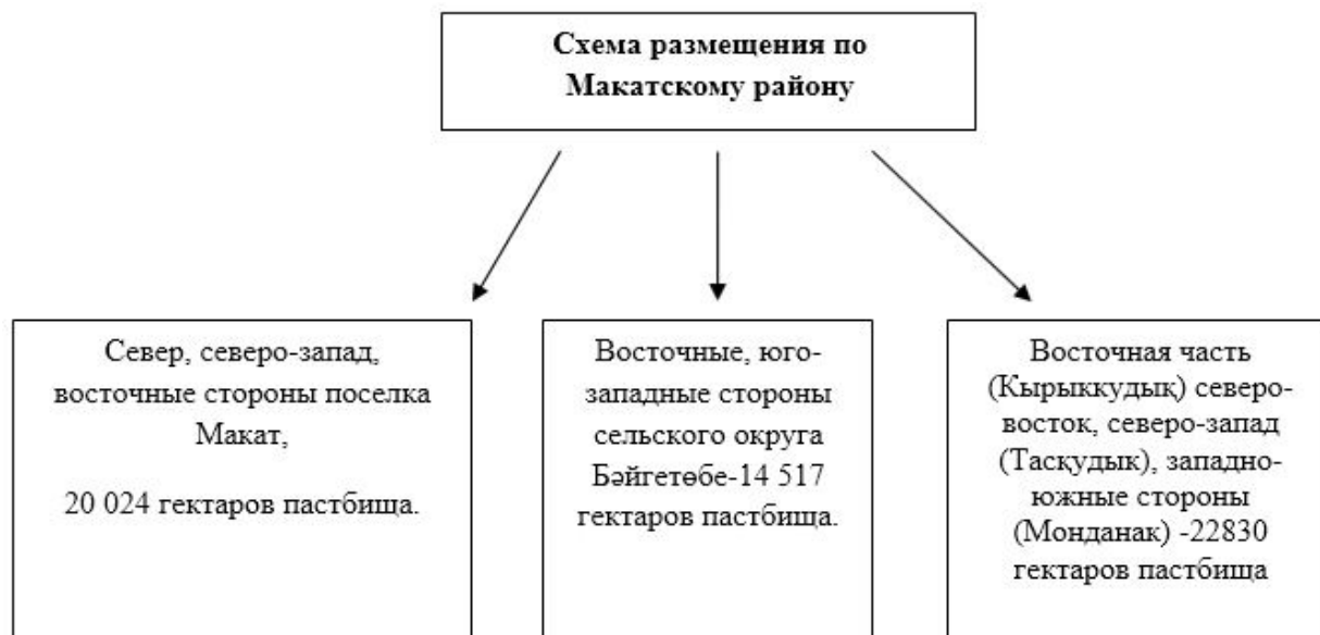
Приложение 3 к плану Макатского района на 2018-2019 годы по управлению пастбищами и их использованию