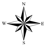
СХЕМА пастбищеоборотов на основании геоботанического обследования пастбищ Сырымского района