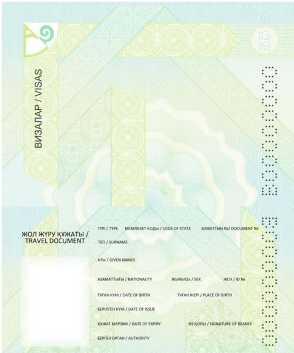
Рисунок № 5. Страница 4-36