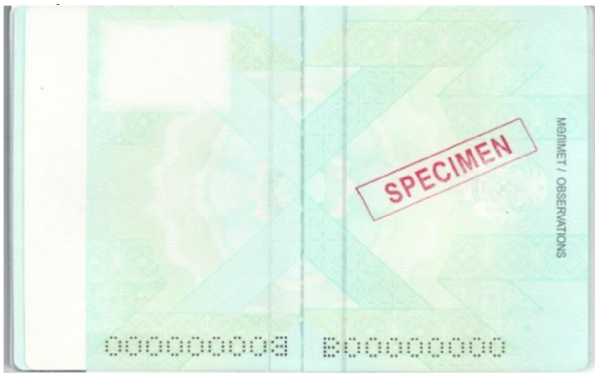
Рисунок № 4