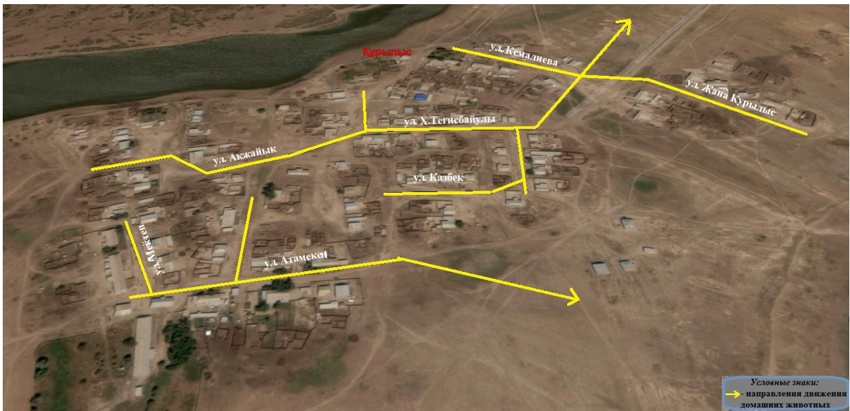
Приложение 11 к решению Атырауского областного маслихата от "21" июня 2019 года № 329-VI