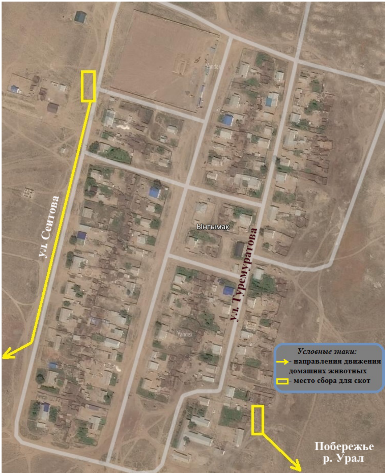
Схема сопровождения животных на пастбищах села Ынтымак

Приложение 10 к решению Атырауского областного маслихата от "21" июня 2019 года № 329-VI