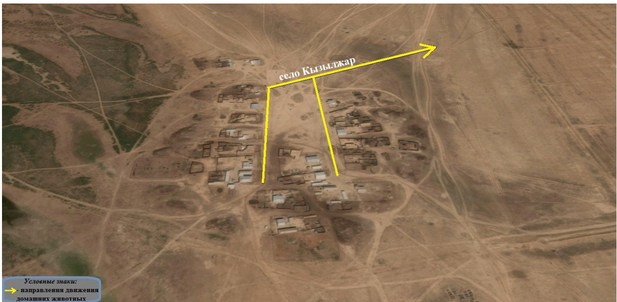
Приложение 12 к решению Атырауского областного маслихата от "21" июня 2019 года № 329-VI