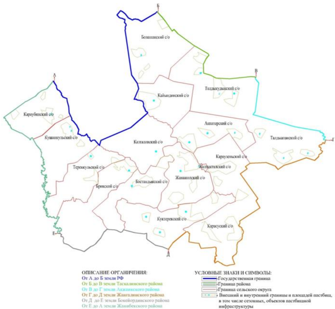
Приложение 4 к Плану по управлению пастбищами и их использованию по Казталовскому району на 2019-2020 годы

Схема доступа пастбищепользователей к водоисточникам (озерам, рекам, прудам, копаням, оросительным или обводнительным каналам, трубчатым или шахтным колодцам), составленную согласно норме потребления воды