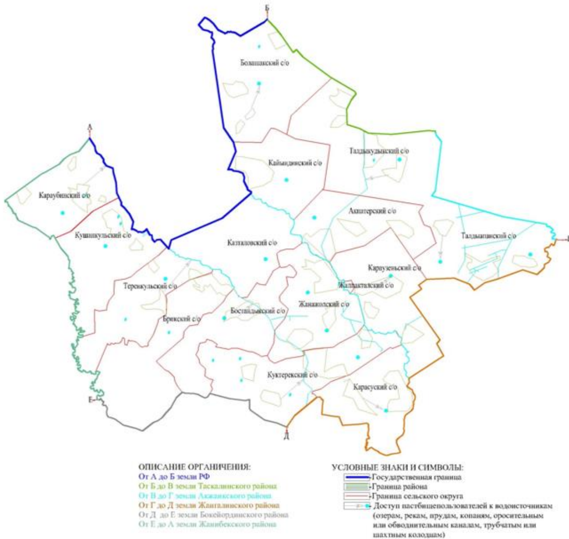
Приложение 5 к Плану по управлению пастбищами и их использованию по Казталовскому району на 2019-2020 годы

Схема перераспределения пастбищ для размещения поголовья сельскохозяйственных животных физических и (или) юридических лиц, у которых отсутствуют пастбища, и перемещения его на предоставляемые пастбища