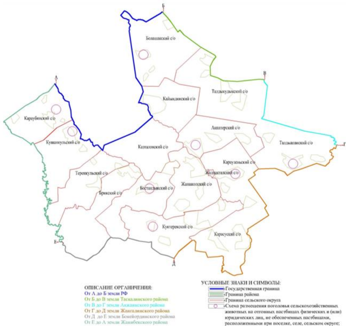
Приложение 7 к Плану по управлению пастбищами и их использованию по Казталовскому району на 2019-2020 годы