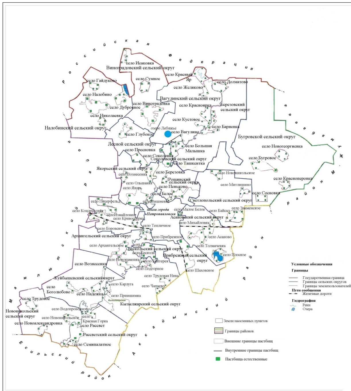
Приложение 4 к плану по управлению пастбищами и их использованию по Кызылжарскому району на 2020-2021 годы