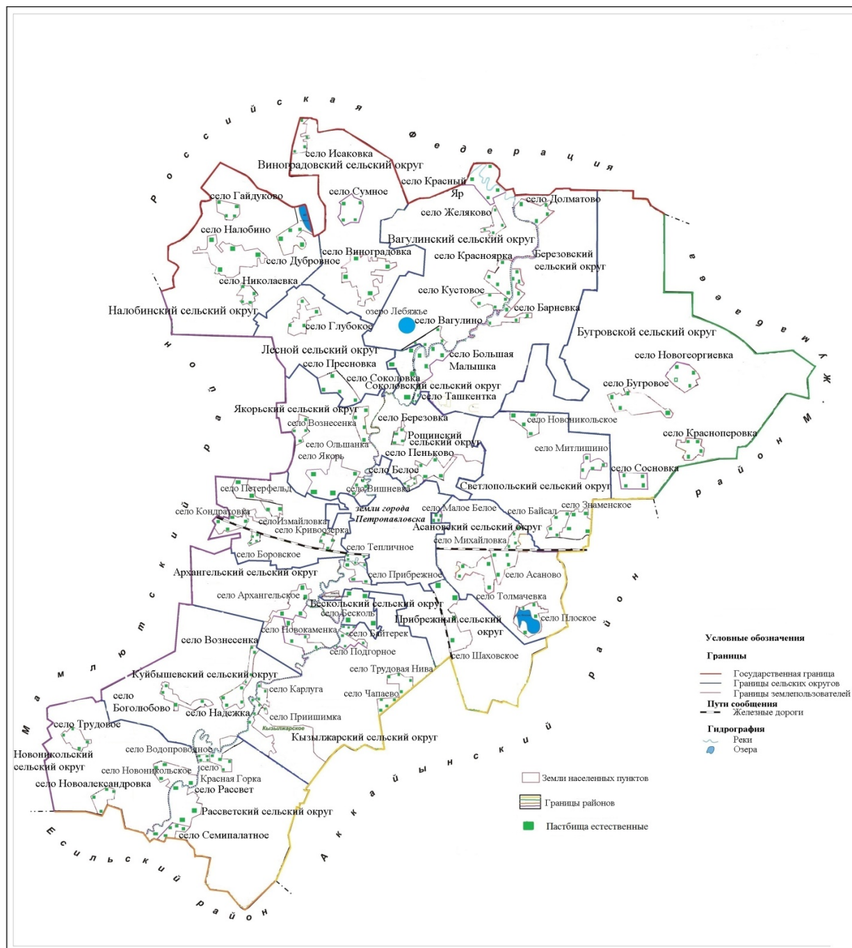
Приложение 2 к плану по управлению пастбищами и их использованию по Кызылжарскому району