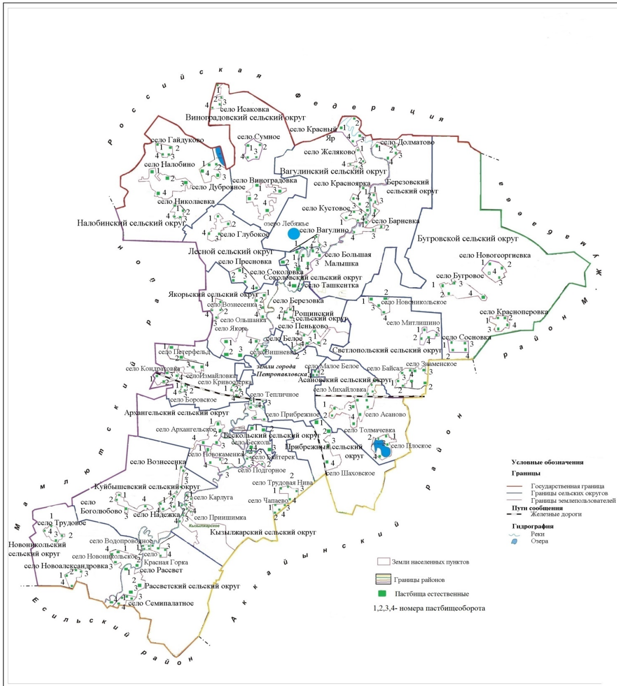
Приложение 3 к плану по управлению пастбищами и их использованию по Кызылжарскому району на 2020-2021 годы