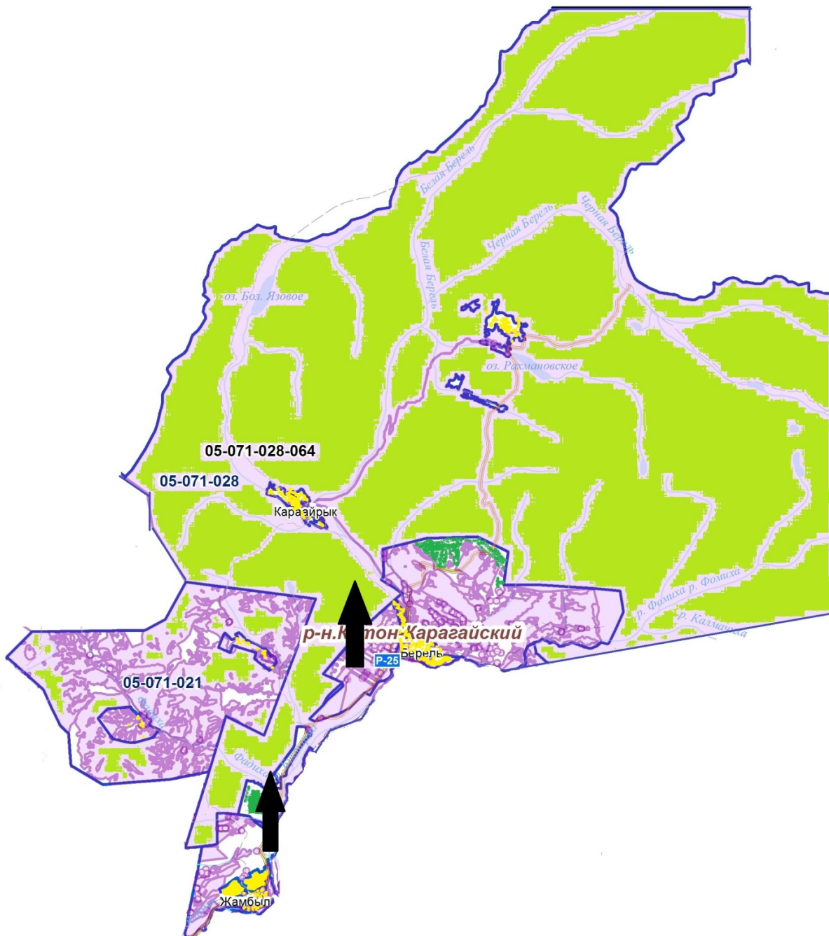
Схема перераспределения пастбищ для размещения поголовья сельскохозяйственных животных физических и юридических лиц, у которых отсутствуют пастбища, и перемещения его на предоставляемые пастбища