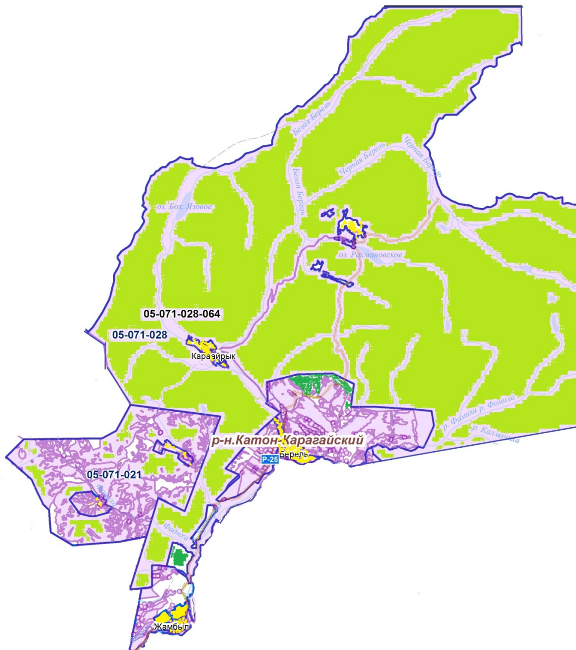
Схема (карта) расположения пастбищ на территории Жамбылского сельского округа в разрезе категорий земель, собственников земельных участков и землепользователей на основании правоустанавливающих документов