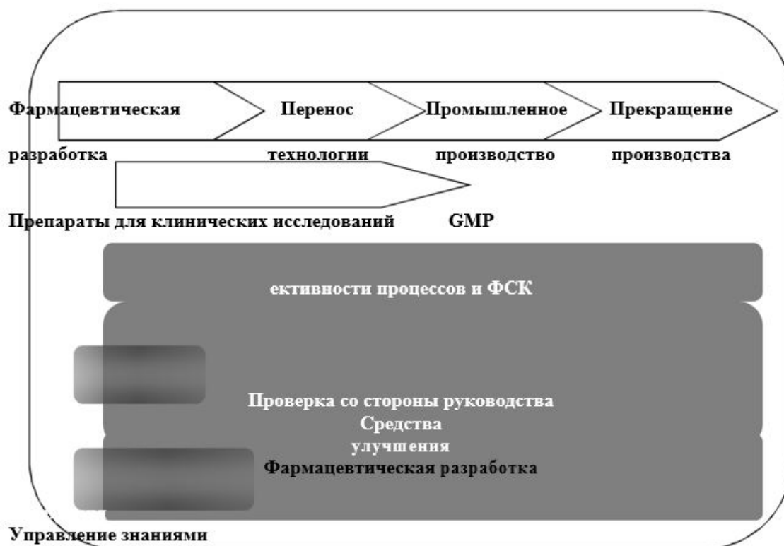
СХЕМА модели фармацевтической системы качества

738. На схеме показаны основные особенности модели фармацевтической системы качества (далее - ФСК). ФСК охватывает весь жизненный цикл продукции, включая фармацевтическую разработку, перенос технологии, промышленное производство и прекращение производства.