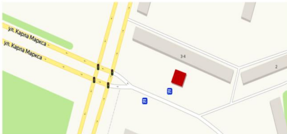
Схема маршрута размещения нестационарного торгового объекта для реализации сельскохозяйственной продукции сроком на 1 год в г.Абай, 2 микрорайон, возле мебельного магазина, между домами №3 и №4.

Приложение 2 к постановлению Акима Абайского района от 4 марта 2021 года № 11/01