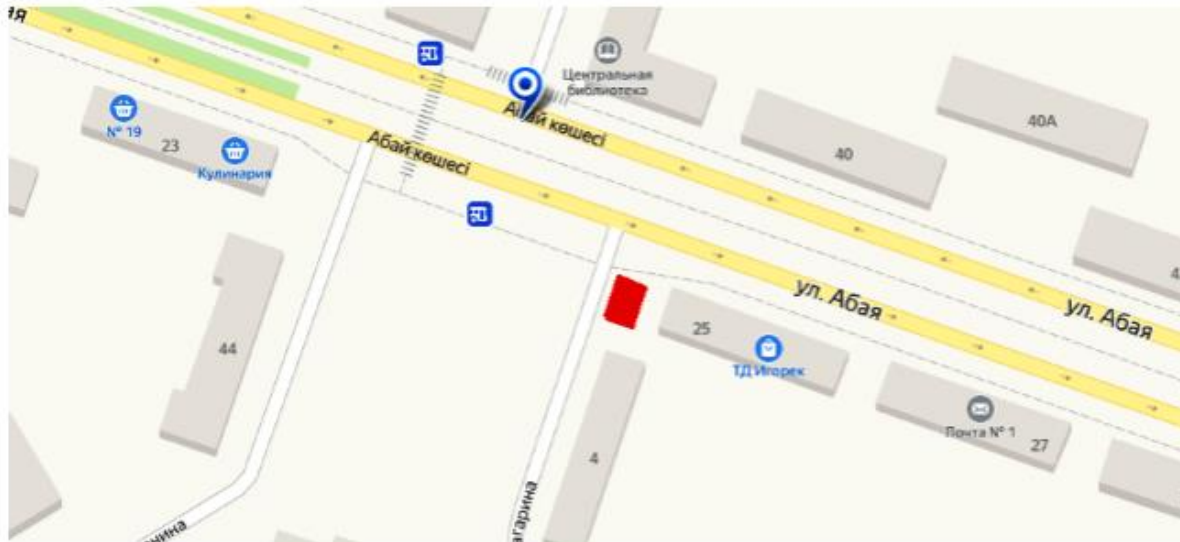
Схема маршрута размещения нестационарного торгового объекта для реализации сельскохозяйственной продукции сроком на 1 год в г.Абай, улица Абая, возле торгового дома "Игорек".

■ Условные обозначения Отведенный земельный участок для размещения торгового объекта Размер 9 м 2 (3х3)