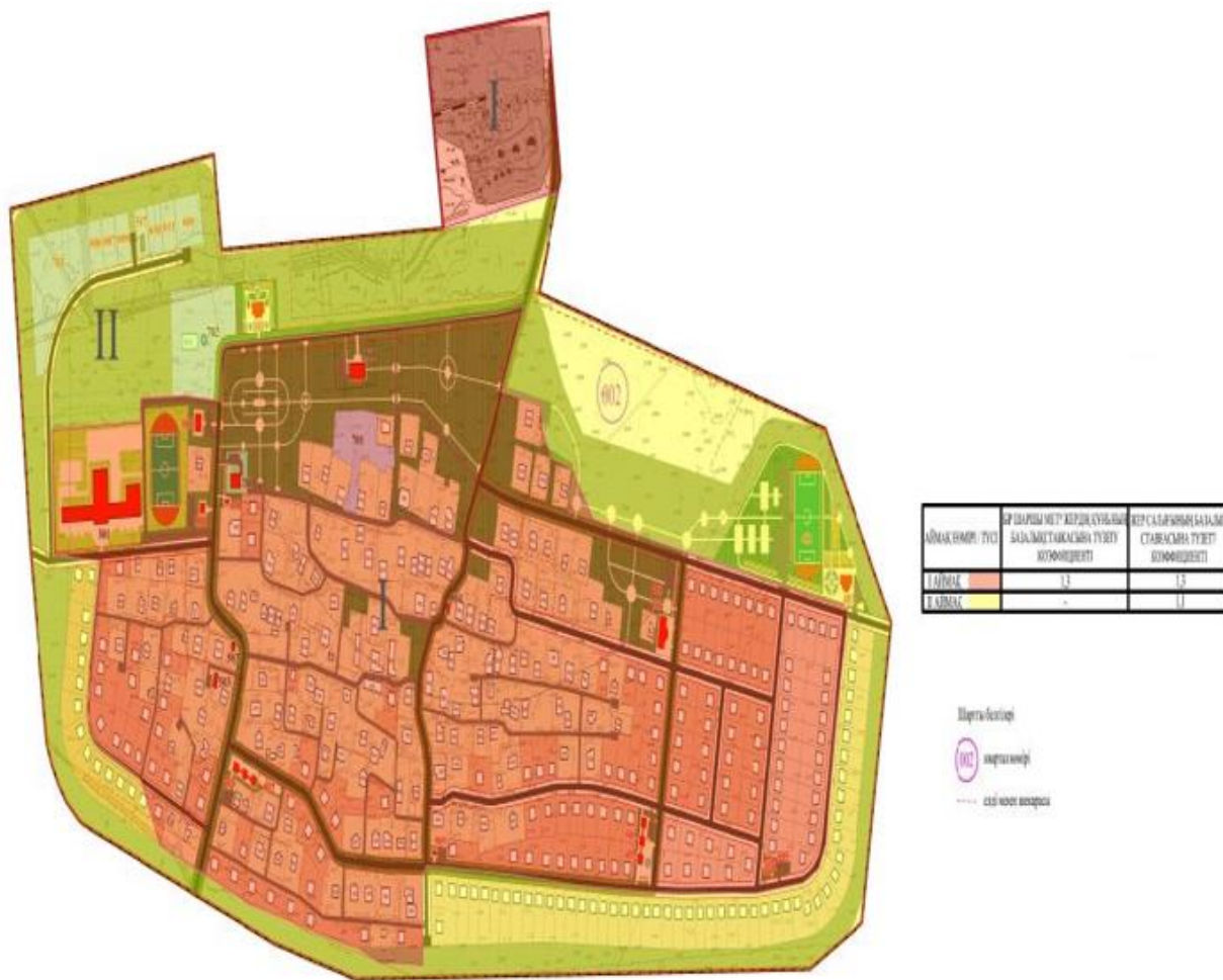
Приложение 4 к решению Макатского районного маслихата от 30 ноября 2023 года 58-VIII